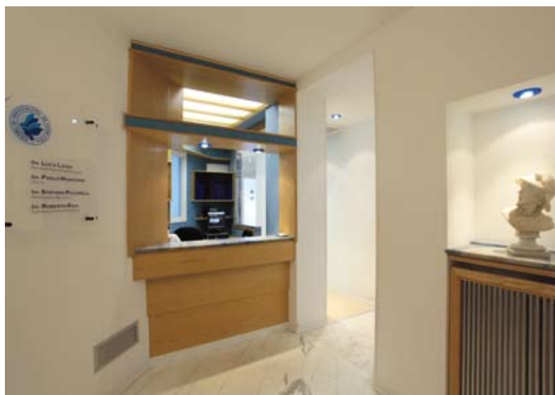
INGRESSO ALLE SALE OPERATIVE E RECEPTION DELLO STUDIO